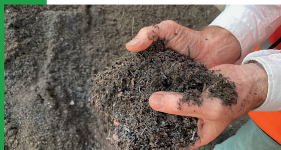
Le compost bénéficie du label bio "Bourgeon Intrants".

L'engagement de la population en tant que premier maillon de la chaîne de tri est donc indispensable afin que nous puissions atteindre ces objectifs et ceci malgré notre trieur optique.